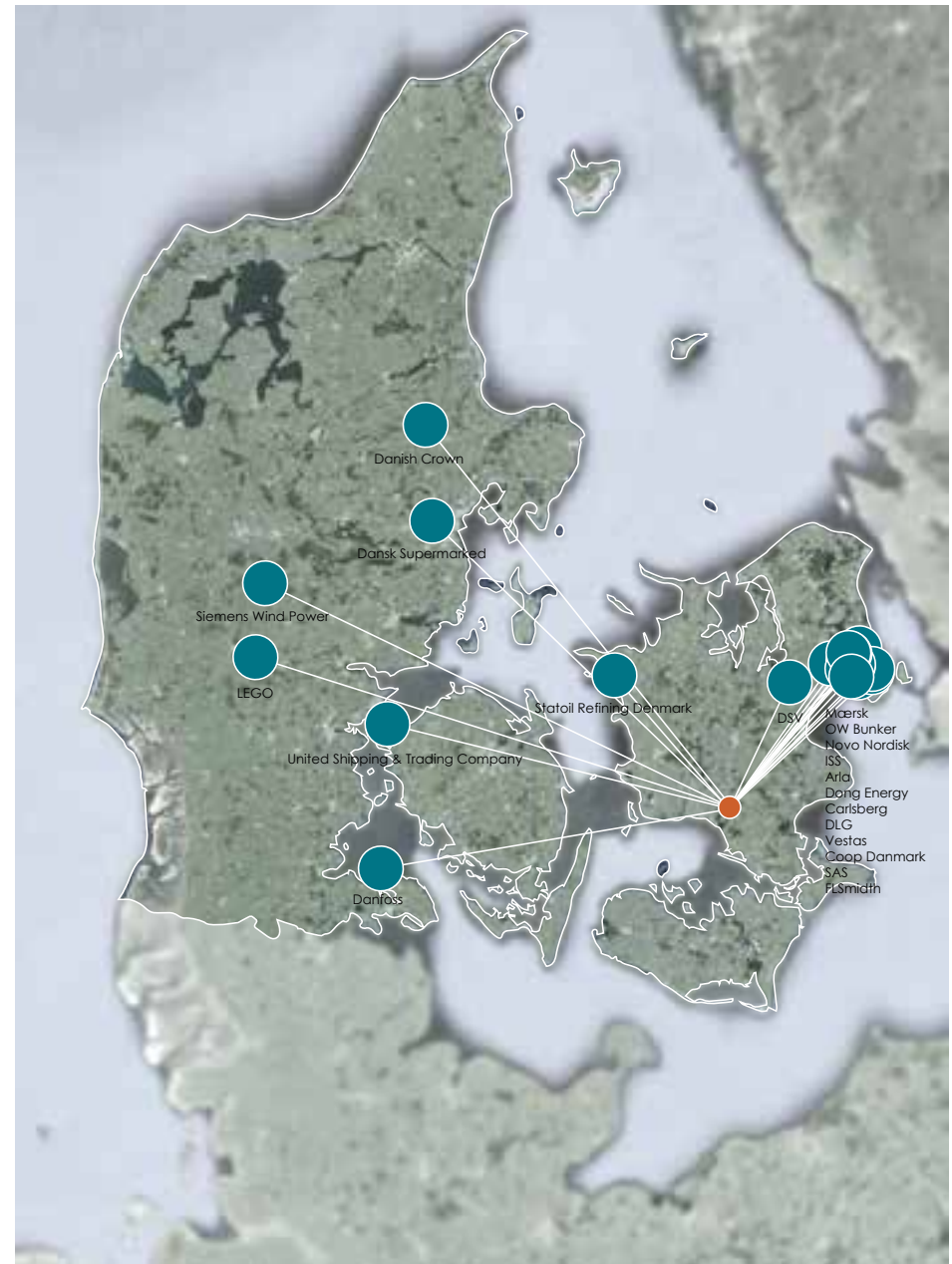
Danmarks 20 største virksomheder i 2014