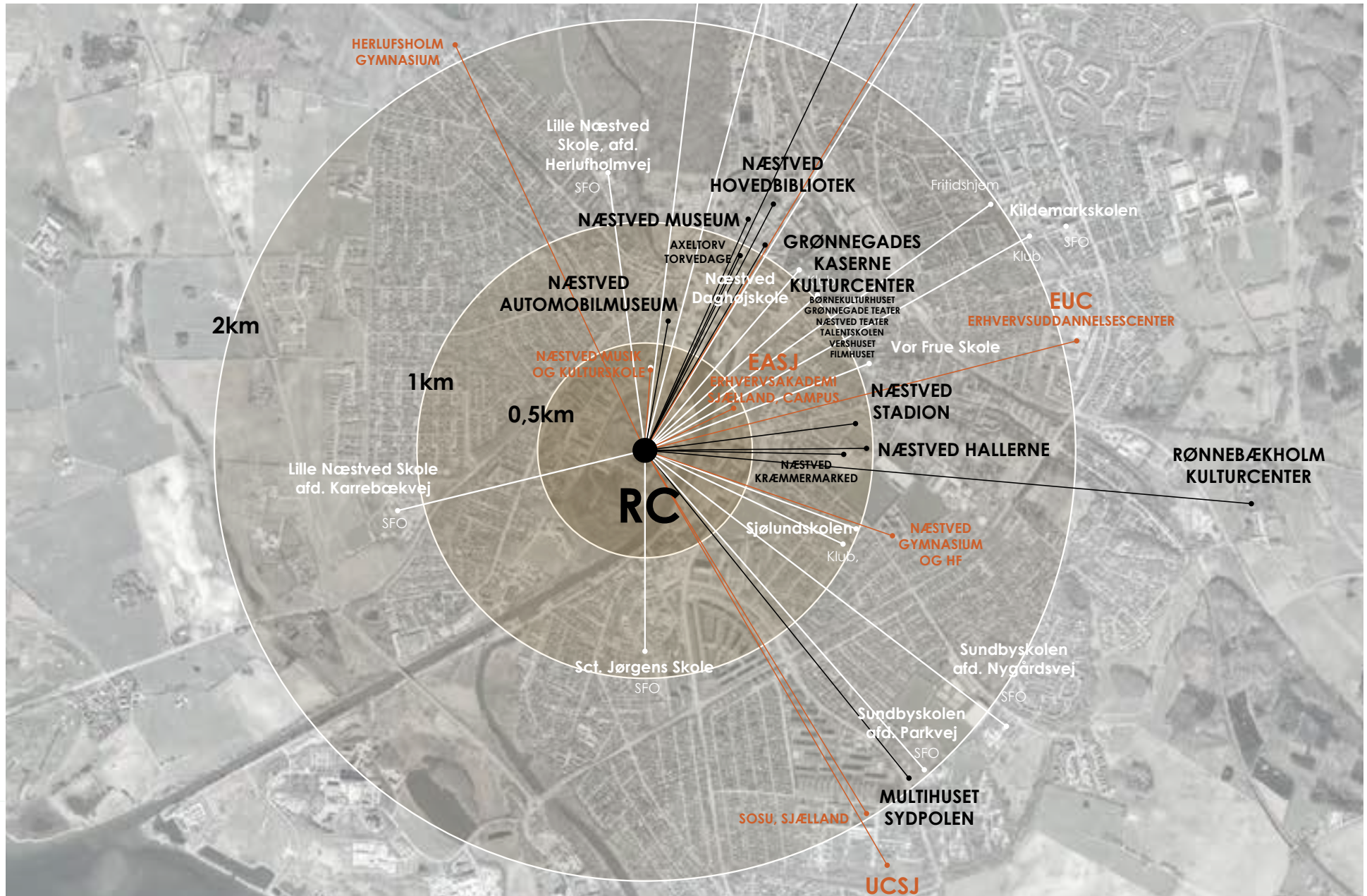
Kulturelle institutioner primært placeret nordøst for Ressource city.