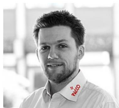
Toste Lund Ventilation: Ventilations- og